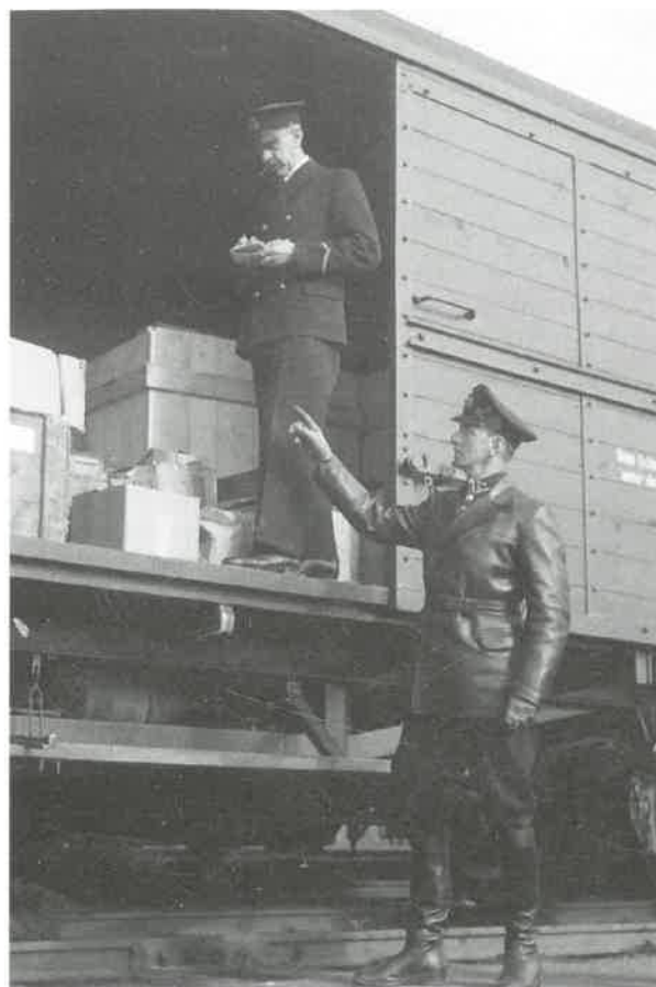
Tyskt godståg vid uppehåll.

Gammelstilla Bruk från 1650-talet. Ny smedja, hytta och en mekanisk verkstad byggdes på 1800-talet. Järnframställningen upphörde på 1910-talet. Kvar finns idag klensmedja, den mekaniska verkstaden med fungerande maskiner, verktyg, snickeri, kraftstation och gjuteribyggnad. På bruket finns en ståtlig byggnad, från 1860-talet, ämnad att bli herrgård och bostad till dåvarande brukspatronens familj. Till bruksidyllen hör den gamla stångjärnssmedjan som används till teaterföreställningar sommartid. På "Höskullen" samt "Stallet" anordnas konstutställningar och sommarserivering. Kan även hyras! Gammaldags Julmarknad sista helgen i november.