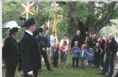
Eken sommaren 2007.