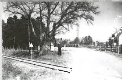
Ekens järnvägsövergång våren 1949.